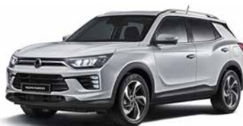
Argintiu Silent (SAI)