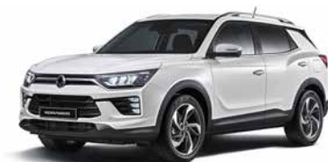
Alb Grand (WAA)

* 5 ani / 100.000 km garanție de producător + încă 5 ani / până la 150.000 km garanție extinsă pentru motor, transmisie și sistem turbosuflantă