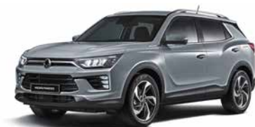
Gri Platinum (ADA)