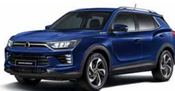
Albastru Dandy (BAS)