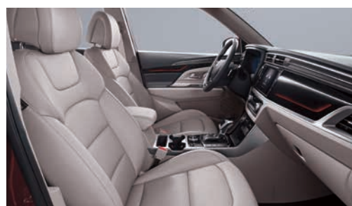
Interior gri (EBG)