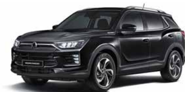
Negru Space (LAK)