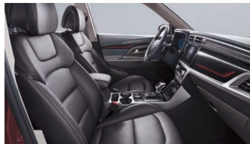
Interior negru (LBH)