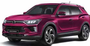
Roșu Cherry (RAV)