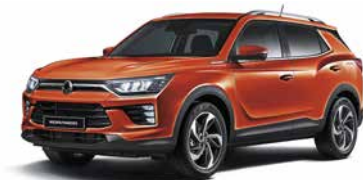
Portocaliu Pop (RAT)