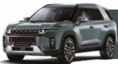
FOREST GREEN (GAO)