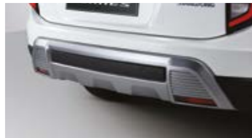
Difuzor spate cu aspect metalic