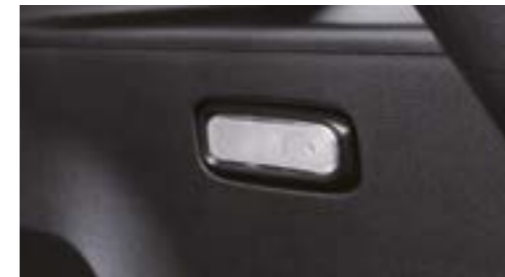
Lumină compartiment bagaje