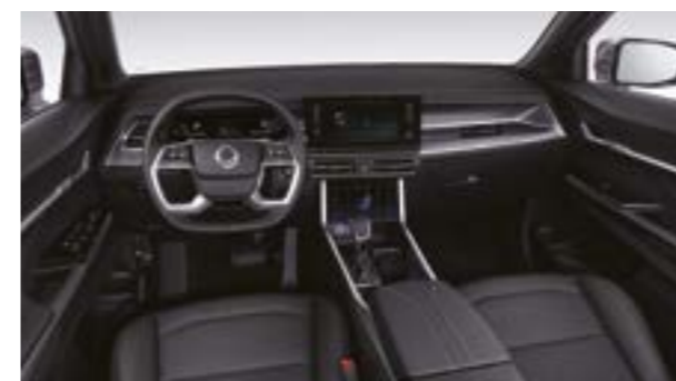
Interior Black (LBH)