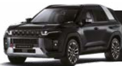
SPACE BLACK (LAK) (numai 1 ton)