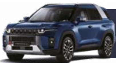
DANDY BLUE (BAS) (numai 1 ton)