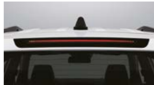
Lumină stop LED montată la înălțime