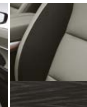
Combinăție tapițerie TPU și material textil - Mix fagure cu textură granulată