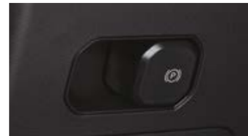
Frână de parcare electronică, cu funcție auto-hold