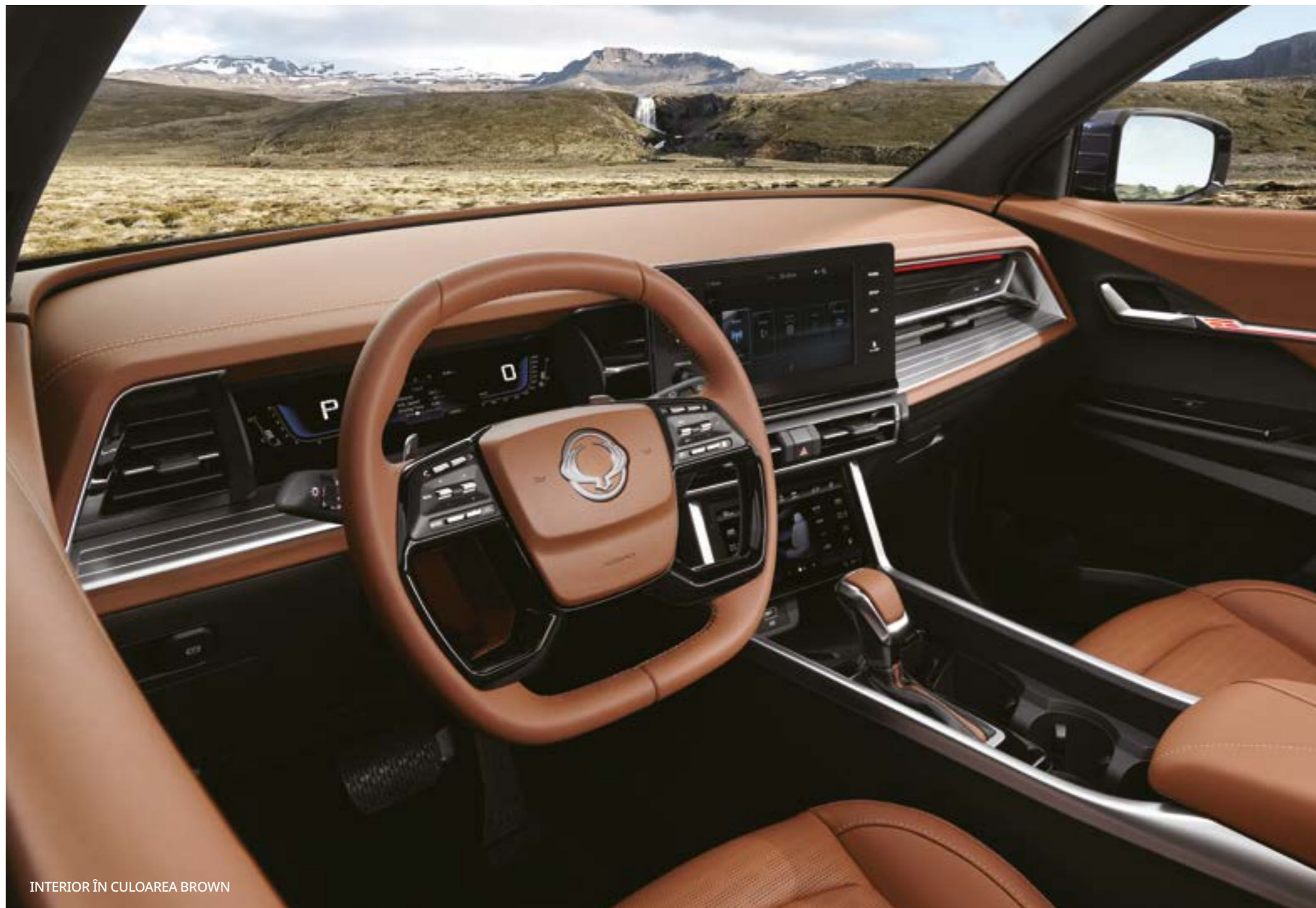
INTERIOR ÎN CULOAREA BROWN