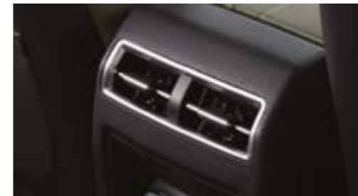
Ventilații de aer pe consola centrală spate