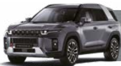
PLATINUM GREY (ADA)