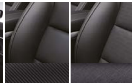
TPU (poliuretan termoplastic) Granulație gri metalic