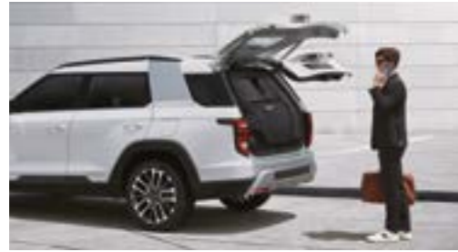
Portieră portbagaj cu acționare electrică