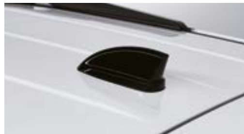
Antenă shark-fin cu GPS