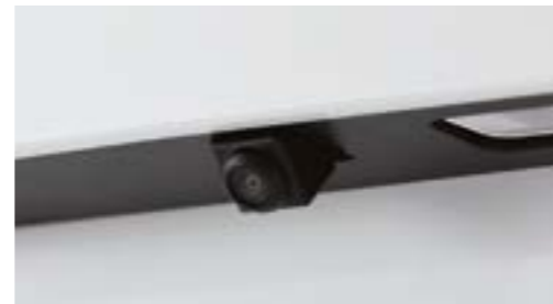
Cameră video HD pentru marșarier