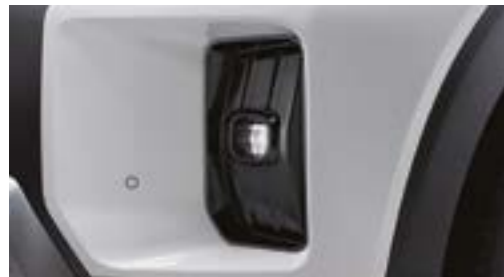
Lumini de ceață față LED