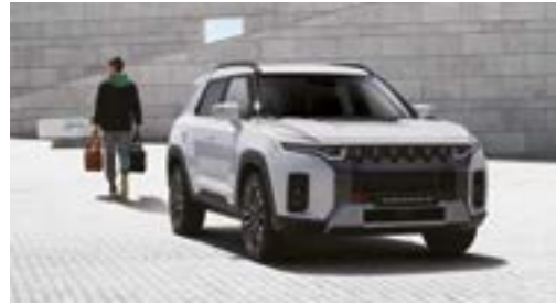
Funcție de închidere automată