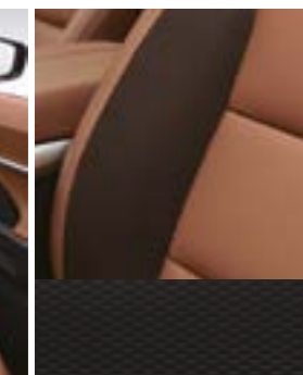
Combinăție tapițerie TPU și material textil - Negru ondulat cu granulație lucioasă