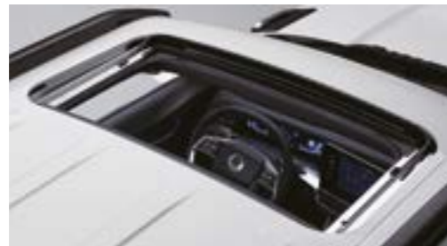
Trapă acționată electric cu funcție de siguranță