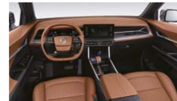
Interior Brown (OBB)