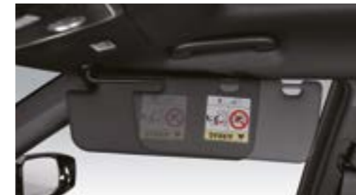
Parasolar cu iluminare și extensie