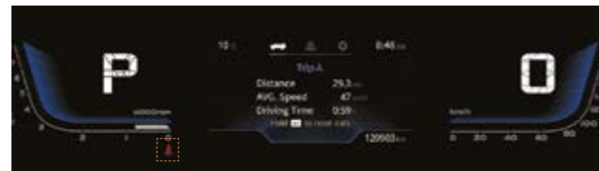
REAMINTIRE CUPLARE CENTURĂ DE SIGURANȚĂ PENTRU TOATE SCAUNELE