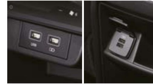
Încărcător USB și mufă USB, față și spate