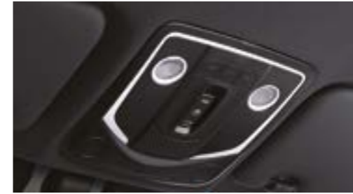
Consolă plafon cu lumină de citire și comutatoare control trapă

CONDUCI MAI INTELIGENT, MAI UȘOR ȘI MAI CONFORTABIL.