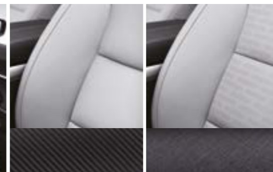
TPU (poliuretan termoplastic) Granulație gri metalic