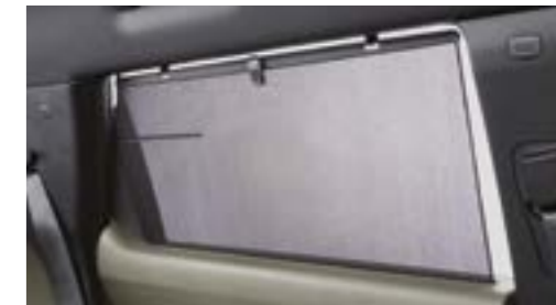
Jaluzele cu acționare manuală