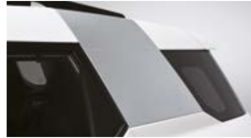
Ornament stâlp C cu aspect metalic