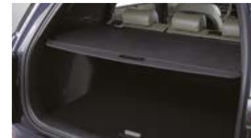
Capac pentru zona de încărcare