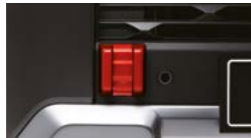
Capac de montare a cârligului de remorcare