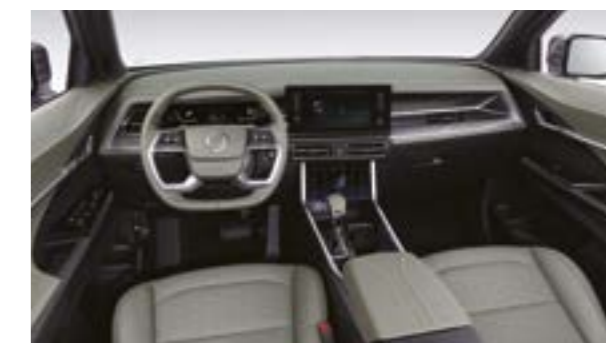
Interior Khaki (GAN)