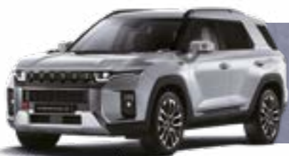
IRON METAL (ADE)