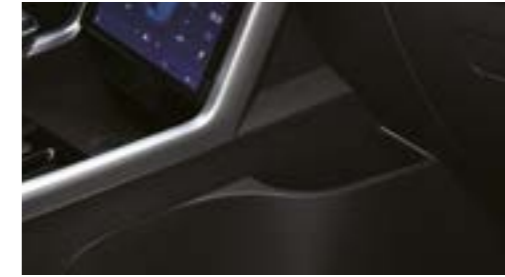
Compartiment depozitare pe lateralul consolei față