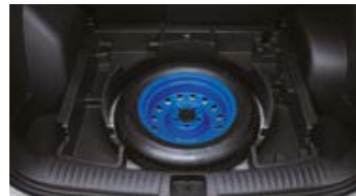
Roată de rezervă temporară

CONDUCI MAI INTELIGENT, MAI UȘOR ȘI MAI CONFORTABIL.