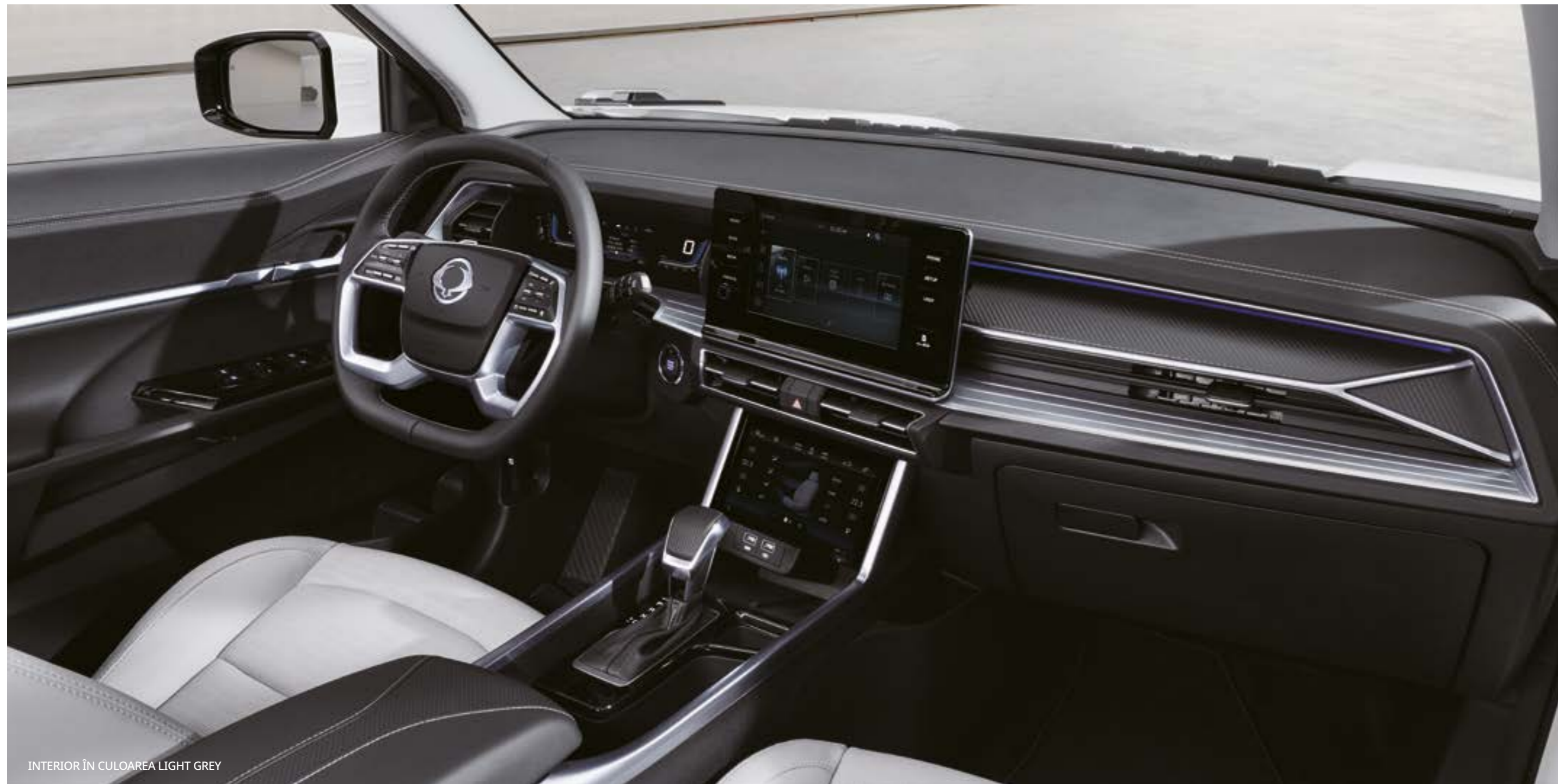
INTERIOR ÎN CULOAREA LIGHT GREY