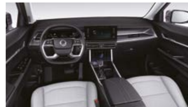
Interior Light Grey (ACE)