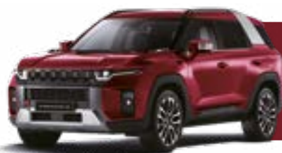
CHERRY RED (RAV)