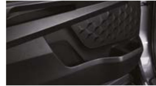
Buzunare pe portiere