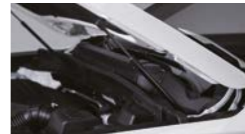
Amortizoare cu gaz pentru susținerea capotei