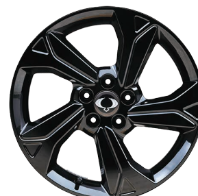
Jante aliaj 18" Diamond Cutting, negre, cu pneuri 215/50 R18

Aceasta lista contine preturi de vanzare maxime recomandate. Atentie: Informațiile prezentate în sistemele digitale de pe autovehicul, meniul calculatorului de bord sau meniul sistemului Audio-Video-Navigație pot fi disponibile în