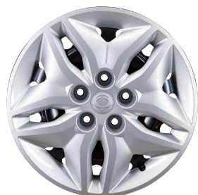
Jante oțel 16" cu pneuri 205/65 R16