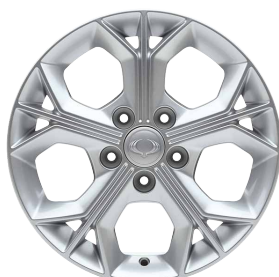
Jante aliaj 16" cu pneuri 205/65 R16